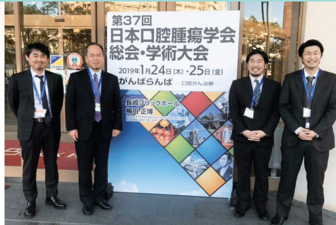
日本口腔腫瘍学会理事長 桐田忠昭先生（左から2番目）とともに

2019（平成31）年1月24日、25日と長崎県の長崎ブリックホールにて開催された、第37回日本口腔腫瘍学会総会・学術大会に参加してきました。