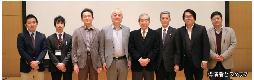
講演者とスタッフ