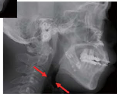
上下顎骨形成術後