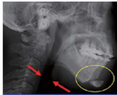
オトガイ形成術後