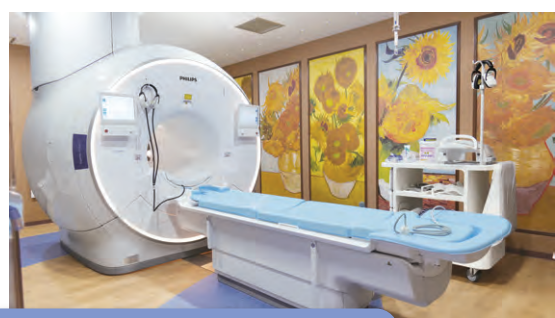
1.5T MRI装置 Ingenia Ambition S

新たに更新導入されたのは 1.5T MRI装置 Ingenia Ambition S (PHILIPS社製)です。この装置の優れている点として、AIと高速撮影技術搭載による検査時間の短縮、高い磁場均一性によりムラの無い安定した画像が得られることがあります。またMRI装置本体の中で、患者さんが